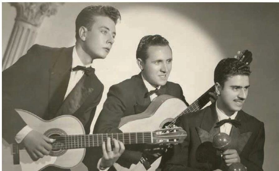
Trío Las Vegas.